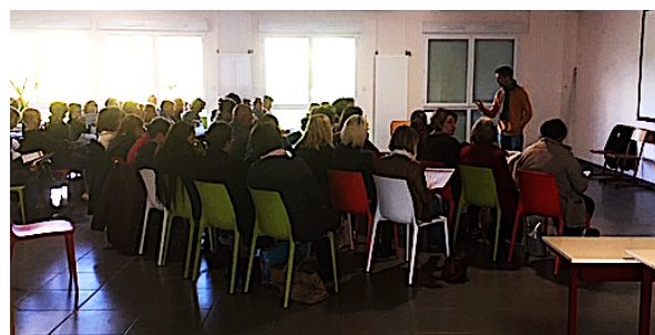
Formation collective le 16 Octobre